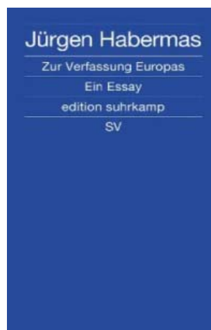
(1) Habermas, Jürgen: Zur Verfassung Europas. Ein Essay, Berlin 2011.

Aus aktuellem Anlass wurde beim letzten Philosophischen Monatsrückblick der Wunsch geäußert, über die "Masse" zu sprechen. Die ältere Dame, die das Thema vorschlug, war irritiert, weil in ihrem Wohnheim zum Halbfinale mit deutscher Beteiligung überall Fahnen hingen. Viele strebten in einen großen Saal, um das Spiel auf einer Leinwand zu verfolgen - darunter auch viele, die sonst mit Fußball nichts zu tun haben wollen. Nicht dass sie es schlimm fände, aber es irritierte sie doch. Bestärkt wurde sie von einer noch deutlich älteren Frau, die in diesem Zusammenhang auf ihr Kindheitserlebnis eines Reichsparteitages hinwies. Es entbrannte eine kontroverse Debatte