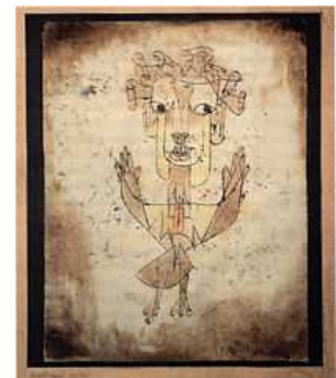
Paul Klee: Angelus Novus

Wie es einem Engel angemessen ist, gab es von Walter Benjamins Engel der Geschichte zuerst ein Bild, bevor er von Benjamin der Logik der Gedanken und Worte einverleibt wurde. Das Bild Angelus Novus stammt von Paul Klee, wurde von Benjamin 1921 erworben und ab da zeitlebens als sein wichtigster Besitz angesehen. Klee selbst hat weitere Engelbilder geschaffen, so etwa das Bild „Engel bringt das Gewünschte“, in dem ein Engel nach Art eines Kellners gezeigt wird. Erst diese aufs äußerste karikierte anthropozentrische Vorstellung der Figur des Engels wirft das rechte Licht auf Rilkes Hinweis, dass wir keine Engel mehr brauchen. Mag es in den Sinn kommen, dass die Engel uns brauchen.