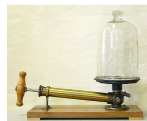
Vakuumpumpe frühes 20. Jahrhundert

2) Das Museum ist hier online abzurufen.