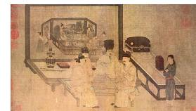
Chinesische Go-Spieler (Malerei von Zhou Wenju, 10. Jahrhundert)

4) Interview mit Heinrich August Winkler vom 4. März 2016: Eine neue deutsche Arroganz? (Börsenblatt des deutschen Buchhandels)