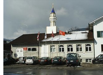
Moschee des Türkischen Kulturvereins Olten mit Minarett Von hier aus führte der Streit um den Minarettneubau 2009 per Volksabstimmung zur Aufnahme eines Bauverbots in die Bundesverfassung der Schweizerischen Eidgenossenschaft.

Interessanterweise wird mit dieser doch recht unbedarften Sicht- und Herangehensweise in einem zentralen Punkt - sicherlich ungewollt - eine fundamentalistische Perspektive eingenommen: Der französische Politikwissenschaftler Olivier Roy bezeichnet moderne fundamentalistische Bewegungen als „entwurzelte Religionen“, also als Religionen, die sich von jeglichem kulturellen Hintergrund lösen, bzw. gelöst haben. (2) Durch diese Loslösung fehlt dem Fundamentalismus (der