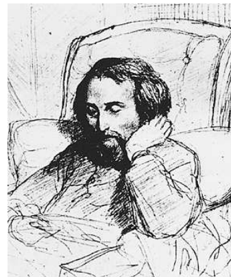
Der kranke Heinrich Heine gemalt von Charles Gleyre. Heines von ihm selbst so bezeichnetes Leben in der Matratzengruft blieb nicht un kreativ. Seine geistige Schaffenskraft ließ in den acht Jahren des Krankenlagers nicht nach.

Die US-amerikanische Philosophin Susan Neiman hat demgegenüber in ihrem Buch „Moralische Klarheit“ Helden gesucht, die in modernen Gesellschaften keinen Schaden anrichten, deren Stärken und Schwächen in die moderne Welt passen und die die Gesellschaften voranbringen können. Diese Suche nach gewissermaßen postheroischen Helden war eine Reaktion auf die