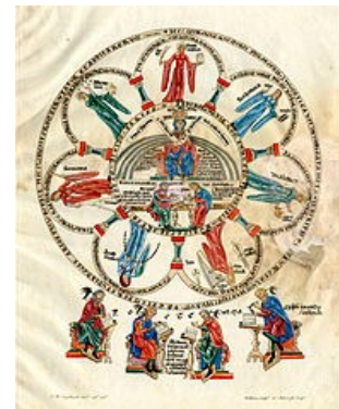
Philosophie mit den sieben freien Künsten. Kupferstich, koloriert aus: Christian Moritz Engelhardt, Herrad von Landsberg, Hortus deliciarum. Stuttgart/Tübingen: Cotta, 1818. Universitätsbibliothek Johann Christian Senckenberg