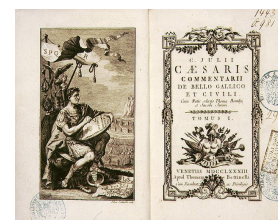
Julius Caesar: Commentarii de Bello Gallico

Bildung, so könnte man die hier deutlich werdende bildungsbürgerliche Lateinfixierung kritisch zusammenfassen, sollte ebensowenig mit Distinktion wie mit Ausbildung verwechselt werden.