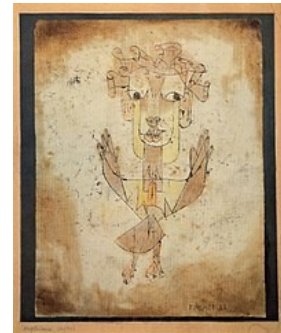
Paul Klee: Angelus Novus (1920)